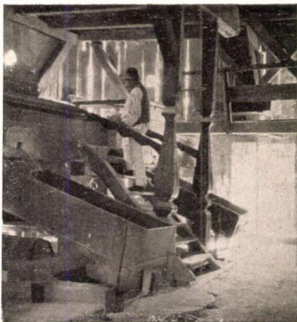
125. FELÜLCAPÓ PATAKMALOM BELSEJE. Az előtérben a „garad”, a szemöldökfán a lisztelőlyuk a lisztelő ládikával. (Székelyföld.)