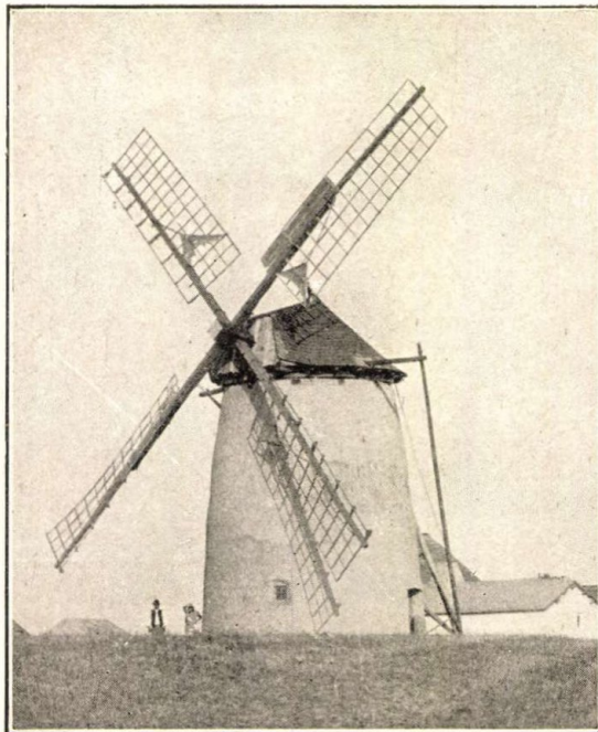
126. NÉGYVITORLÁS, TORNYOS SZÉLMALOM. A tető és a vitorlák a földön guruló fordítókerékkel (jobbaldalt), a fal párkányán körben forgathatók. (Kiskunság.)